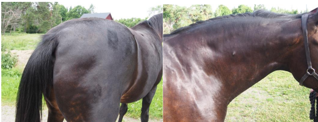
Regional fettansättning kring svansrot samt "fettacke" hos häst med EMS.

Den senaste tidens forskning inom ämnet EMS debatterar kring fetmans roll i utvecklandet av syndromet. Hästar som drabbas av EMS har som beskrivet här ovan – i många fall en ökad generell och/eller lokal fettansättning. Med ökad kunskap om hästarnas fenotyp kopplat till graden av insulinresistens, bedömmar man det dock nu som mer troligt att fetman har en sekundär roll snarare än en primär i utvecklandet av EMS. Detta innebär att fetma i sig kanske inte ger upphov till EMS, men att ökad fettansättning i kombination med andra predisonerande faktorer driver den negativa spiral som gör att hästarnas insulinkänslighet försämras, och som slutligen gör att de lider ökad risk för att drabbas av fång 12-14 . De nyaste rönen inom forskning har även visat att hyperinsulinemi som uppstår efter utfodring, är en viktig orsak till att insulinresistens förvärras ytterligare hos hästar med EMS. Detta stödjer budskapet om att rätt utfodring är fullständigt nödvändig för dessa hästar, för att insulinkänsligheten ska förbättrats så att risken för att drabbas av fång minskar 13 .