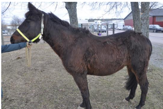
Ofullständig fällning av vinterpäls hos häst med obehandlad PPID.

Behandling av hästar med PPID går ut på att öka stimuleringen av dopaminreceptorerna i pars intermedia – för att öka graden av hämning på POMC och därmed åstadkomma en minskad frisättning av ACTH 18 . Det finns idag ett läkemedel registrerat för behandling av hästar med PPID (Prascend). Den aktiva substansen i Prascend (pergolide mesylate) är en dopaminagonist. Förutom medicinska behandling är parasitkontroll, förebyggande tand- och hovvård, samt en anpassad utfodring (högt innehåll av fett- och protein, lågt innehåll av lättlösligt socker) viktiga delar i behandlingen av hästar med PPID.